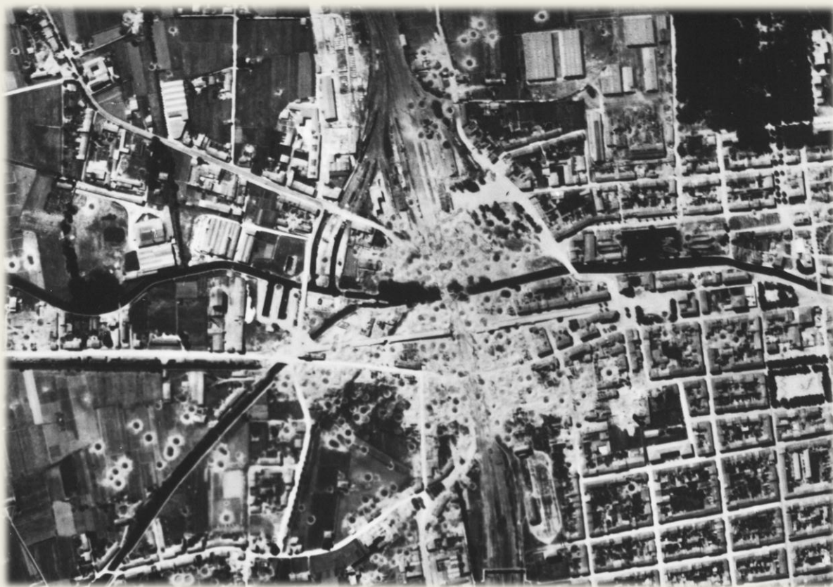
La zona più colpita dai bombardamenti in una foto aerea del 1944