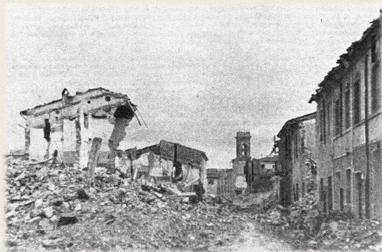
Case distrutte in via Puccini Sullo sfondo il campanile della SS. Annunziata

Dal 14 novembre 1943, a seguito dell'aggravarsi della situazione, tutta la città fu dichiarata dal comando tedesco