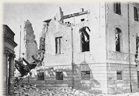
Una parte del palazzo del Municipio demolito dai bombardamenti

Il territorio di Viareggio interessato dal provvedimento di evacuazione fu diviso in 12 "zone", stabilendo per gli abitanti di ciascuna "zona" una sistemazione in altrettanti comuni della provincia di Lucca. Il programma di sfollamento forzato fu così organizzato: nel giorno stabilito per la partenza, tutti gli abitanti della "zona" interessata dovevano far trovare le masserizie e gli oggetti personali che intendevano portare con loro sulla strada, davanti alle loro abitazioni, per essere trasportate con automezzi e carri a cavallo alla stazione e caricate sui treni. Tutto quanto non poteva essere portato al seguito, doveva essere lasciato nelle case, per essere ritirato in seguito, quando fossero venute meno le condizioni che avevano imposta l'evacuazione della città. La prima zona fu sgombrata il 19 aprile con destinazione Castelnuovo Garfagnana, successivamente e fino al 30