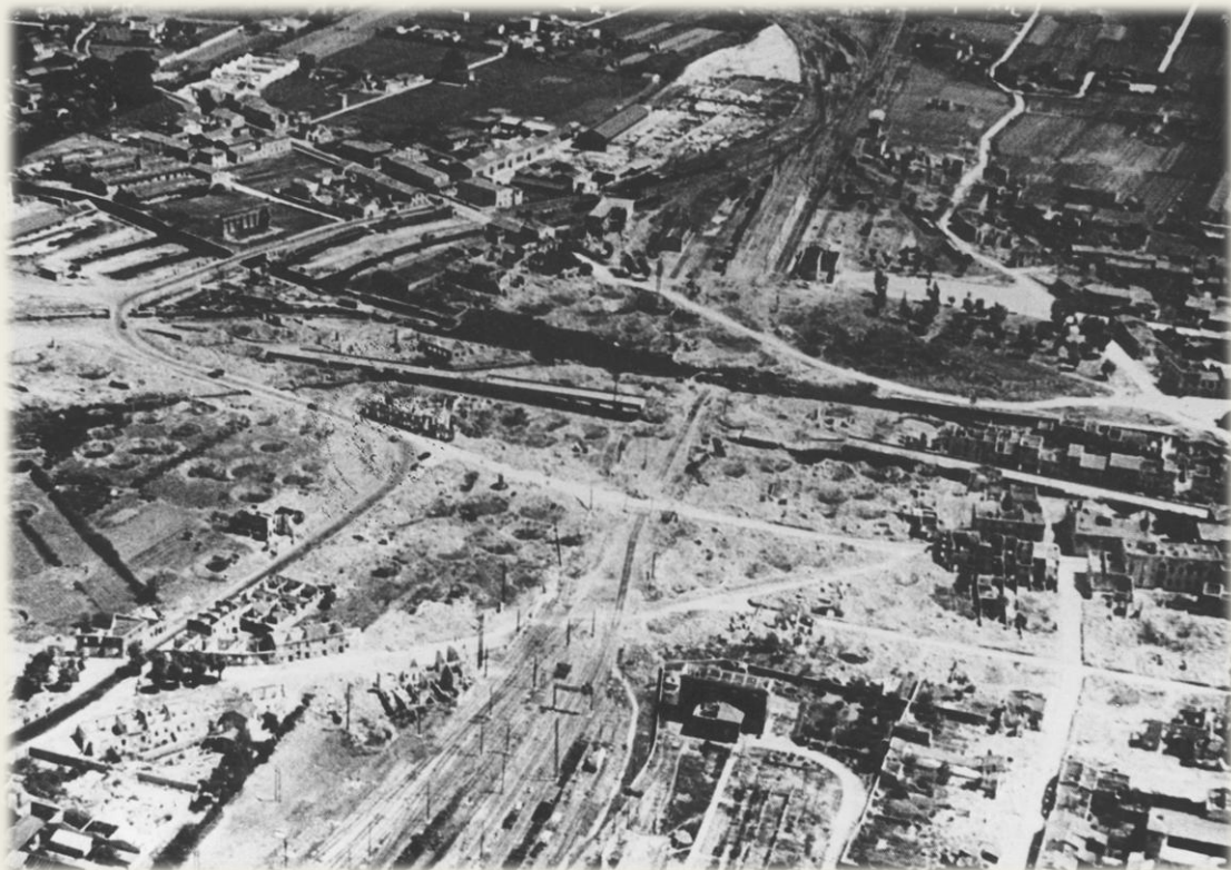
Il cavalcavia e la zona ferroviaria dopo i bombardamenti aerei del 1944

Fonte: Francesco Bergamini, Giuliano Bimbi, Antifascismo e Resistenza in Versilia, Viareggio 1983